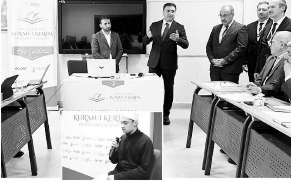
Farklı başlıklar altında Kur'an-ı Kerim Öğretimi'nin ele alındığı çalıştay, gün sonunda sertifika töreni ve hatıra fotoğrafının çekilmesi ile son buldu.