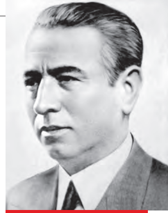
ORD. PROF. ALİ FUAD BAŞGİL

İrtica varmış; softalar, yobazlar, Medeni Kanun düşmanları hep bir ağızdan şeriat istiyorlarmış. Zavallı Müslüman halkımız! Gazetesiz, müdafaasız, sahipsiz efendimiz! Bu sana, doyurup beslediğin zengin edip yaşadığın nankörlerin adice bir iftirası ve hakaretidir.